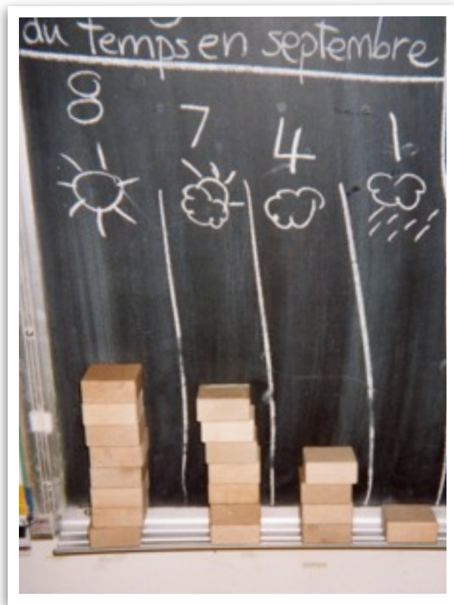
Diagramme à bandes du temps qu'il a fait

Lorsque je dessine le temps qu'il fait chaque jour sur le calendrier, les enfants apprennent vite les termes ensoleillé, partiellement ensoleillé, nuageux, il pleut ou il neige. Avant de remettre le calendrier du mois qui vient de finir sur le mur, à sa place dans la ligne de temps, j'invite les enfants à faire collectivement l'histogramme du temps: ils comptent avec moi les journées selon la colonne dessinée au tableau. Le nombre de jours est représenté par un nombre équivalent de blocs. En novembre, je leur donne une grande feuille (11 x 17) et ils dessinent un histogramme qu'ils mettront dans leur portfolio.