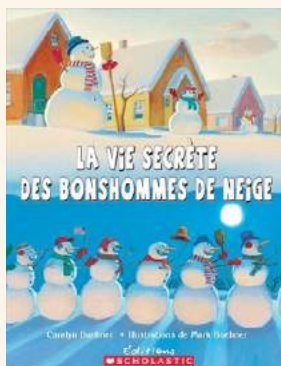
Buehner, C. et Buehner, M. (2006). La vie secrète des bonshommes de neige . Scholastic Canada.