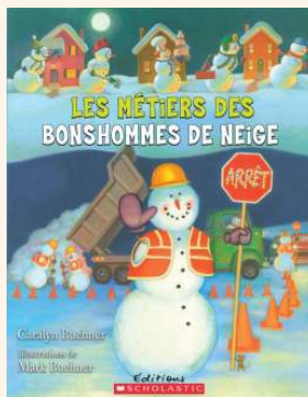
Buehner, C. et Buehner, M. (2013). Les métiers des bonshommes de neige . Scholastic Canada.